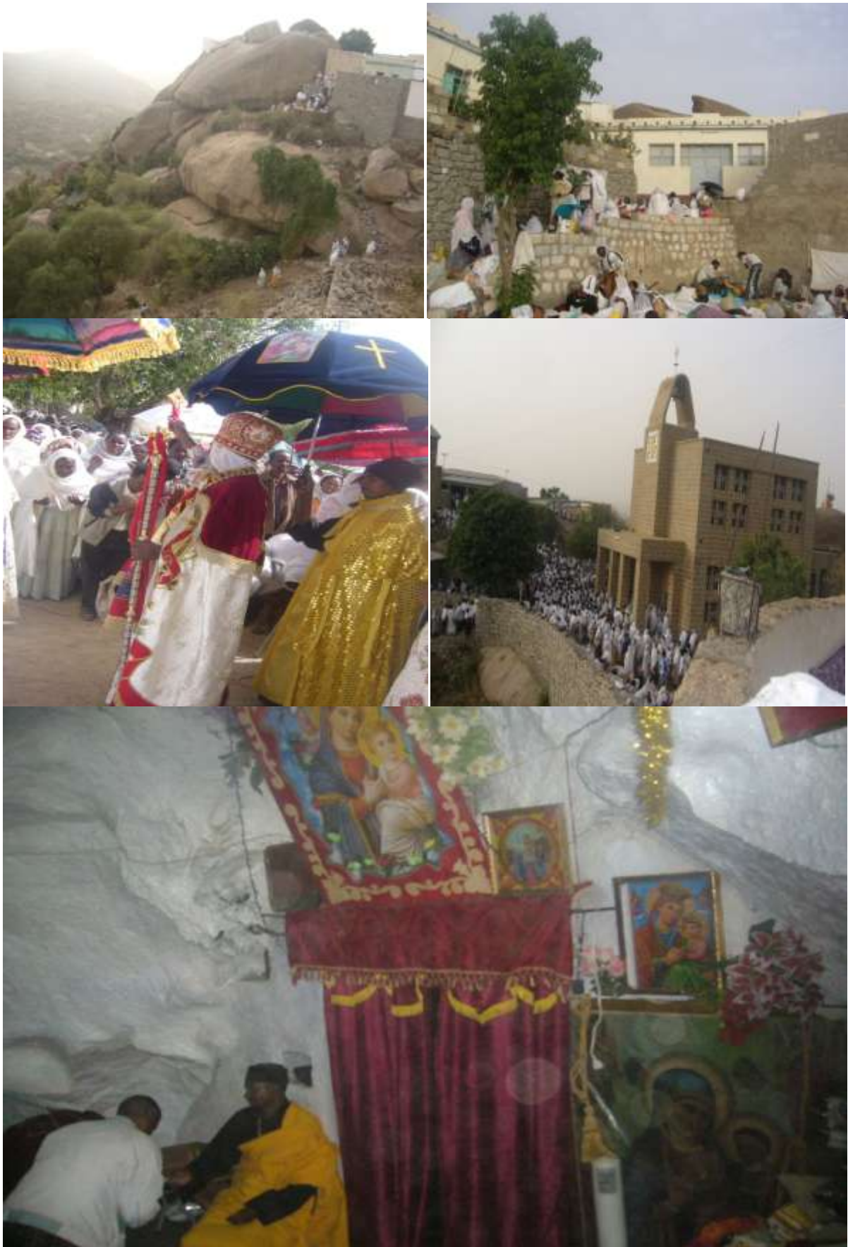
ስጌላ ብ ሊድያ ዮሃንስ 21 ሰኔ 2002 ዓ.ም